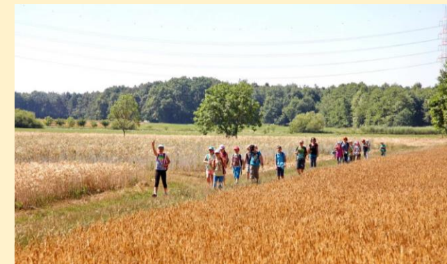
Ein Wander- und Studientag der Lessingschüler

Der Rundweg lädt Spaziergänger und Radfahrer zum Kennenlernen der Feldflur und der näheren Umgebung von Erzhausen ein. Er besteht aus dem westlichen Halbmond, der 6,0 km (Spaziergänger) und 4,8 km (Radfahrer) lang ist und dem östlichen Halbmond von 5,2 km Länge. Eine Nord-Süd-Spange quert den alten Ortskern. Sie misst 1,9 Kilometer.