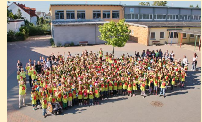
24.6.2014 Im Schulhof Gruppenfoto vor der Wanderung